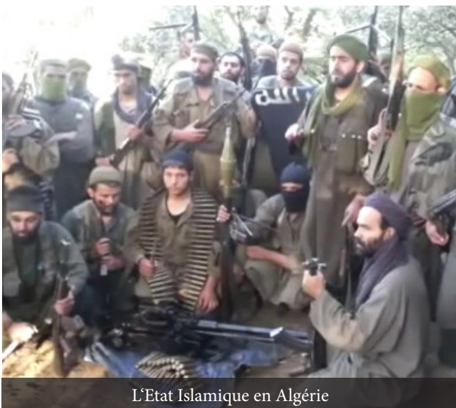
L'Etat Islamique en Algérie

« Le monde a vu et a entendu les avions du Tâghoût de la péninsule qui n'ont jamais été lancés un jour pour défendre les femmes sunnites en Irak ou leurs enfants au Châm qui subissent la persécution et les massacres aux mains des nousayrites et des rawâfid, mais pire, les avions de la famille de Saloûl sont lancés pour frapper les rangs des moudjâhidîn qui défendent les gens de la Sounnah en Irak et au Châm et pour effacer l'espoir qui est né aux musulmans par les actions des moudjâhidîn. Et le Tâghoût de la Péninsule a pensé que les monothéistes du pays des deux lieux saints resteraient sans rien faire. Et qu'ils se tairont sur les machinations des juifs et des croisés dans la région. Non ! Nous sommes biens les enfants de la péninsule des monothéistes, nous annonçons la levée de l'étendard du Djihâd dans le pays des deux lieux saints et le fait que nous rejoignons le convoi du Califat. »