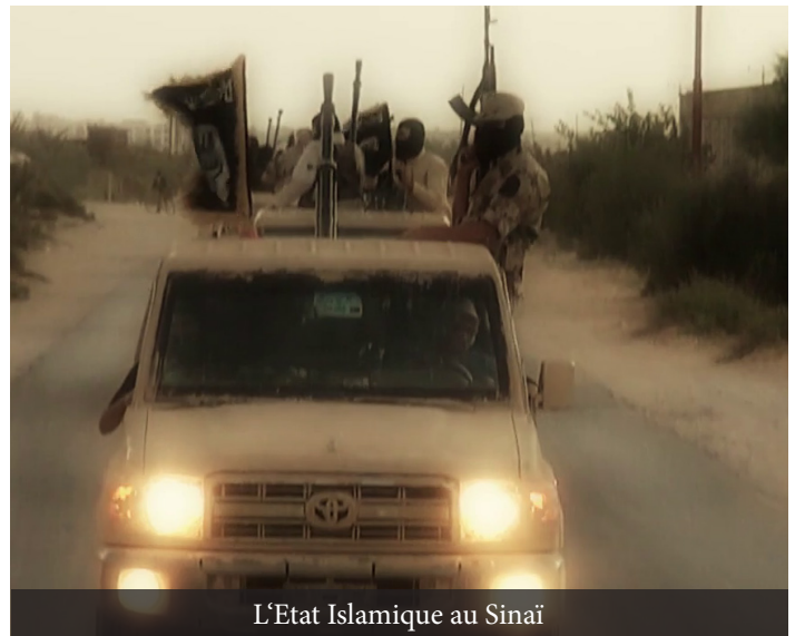
L'Etat Islamique au Sinaï

« Y a-t-il aujourd'hui un Imâm (Calife) qui a les conditions du Califat autre qu'Aboû Bakr Al-Baghdâdî ? Ordonne-nous donc Ô Calife des musulmans ce que tu veux, nous sommes les gens de l'aide et du secours, et nous sommes ton armée au Yémen et bientôt Allâh te fera entendre ce qui te réjouira. Allâh a certes rassemblé sous ton ordre, Ô Califat des musulmans, les soldats du Châm, de l'Irak et du Yémen. D'après 'Abd Allâh Ibn Hawâlah (qu'Allâh soit satisfait de lui), il a dit : Le Messager d'Allâh (paix et bénédictions sur lui) a dit : « Le jour viendra où