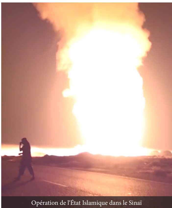
Opération de l'État Islamique dans le Sinaï