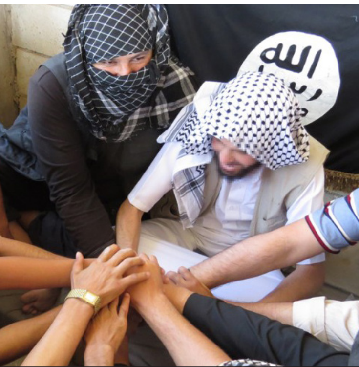
Serment d'allégeance au Calife Ibrâhîm (Qu'Allâh le préserve)