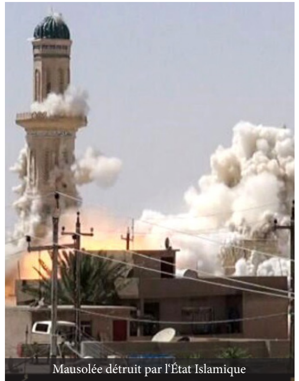
Mausolée détruit par l'État Islamique

L'Etat Islamique, dirigeants et soldats pratiquent le Tawhîd, l'enseignent dans leurs mosquées, instituts et leurs camps d'entraînements et ils combattent pour l'établir partout sur la terre. Et c'est à cause de cela qu'Allâh leur a donné ces conquêtes, qu'il leur a permis de rétablir le Califat et a fait