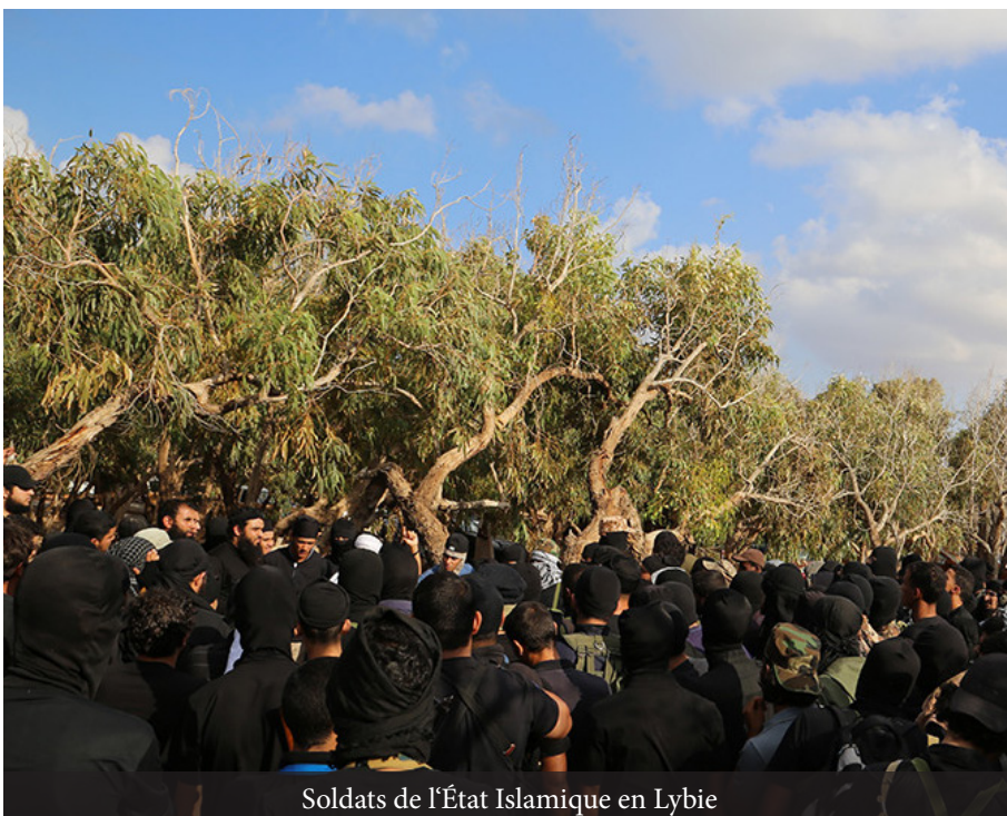
Soldats de l'État Islamique en Lybie