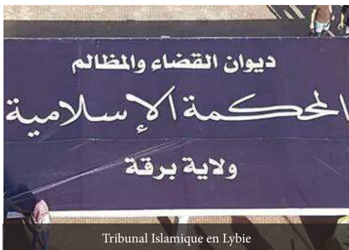
Tribunal Islamique en Lybie

Suite à ces allégeances le Calife Aboû Bakr Al-Baghdâdî (qu'Allah le préserve) a donné une réponse positive en disant :