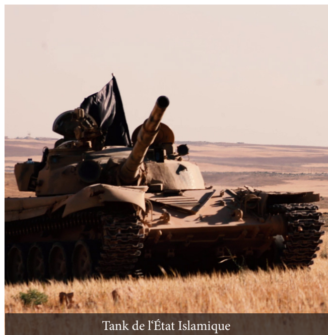
Tank de l'État Islamique

Les partisans du Tâghoût (policiers, militaires, savants et mouftis) qui l'aident à appliquer sa loi de mécréance sur la terre sont des idolâtres et ils ont